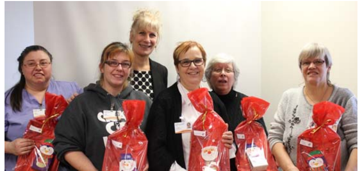
15 à 19 années d'ancienneté