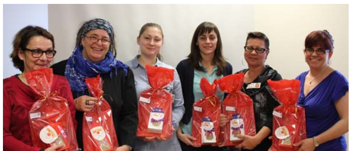
Moins de 4 mois d'ancienneté