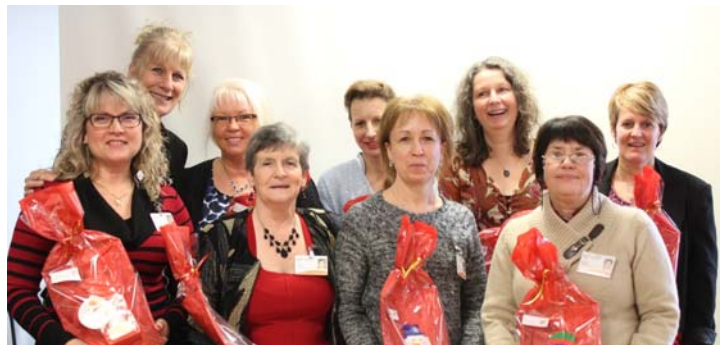
5 à 9 années d'ancienneté