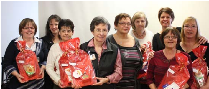
10 à 14 années d'ancienneté