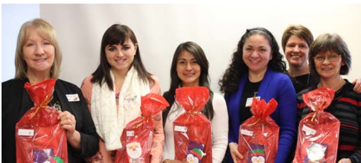
4 mois à 1 an d'ancienneté