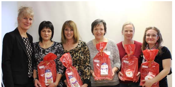
1 à 2 années d'ancienneté