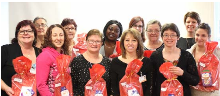
2 à 4 années d'ancienneté